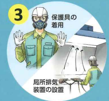
リスク低減措置の実施