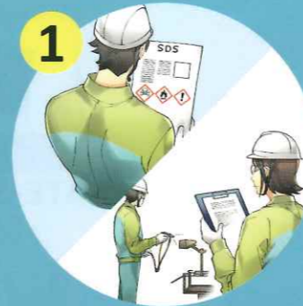
SDS及び作業現場の確認