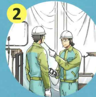
リスクアセスメントの実施