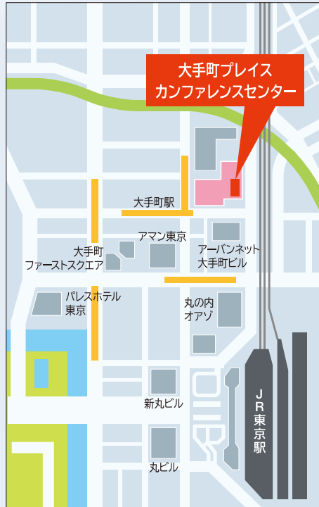
〈会場周辺MAP〉 JR 東京駅から徒歩7分

〈主催〉公益財団法人福島イノベーション・コースト構想推進機構、福島県 〈共催〉経済産業省 〈後援(予定)〉いわき市、相馬市、田村市、南相馬市、川俣町、広野町、楡葉町、富岡町、川内村、大熊町、双葉町、浪江町、葛尾村、新地町、飯館村、 公益社団法人福島相双復興推進機構、一般社団法人日本経済団体連合会、日本商工会議所、全国商工会連合会、独立行政法人中小企業基盤 整備機構、全国中小企業団体中央会、一般社団法人中部産業連盟、特定非営利活動法人ロボットビジネス支援機構、株式会社東邦銀行