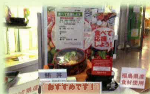
被災地産食品を使用したメニューの提供