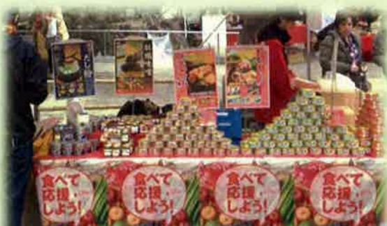
被災地産食品の販売フェア