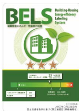
〔図1〕 ガイドラインに基づく第三者認証の例

また、ダイヤモンドリスponsに対応した時間帯別・季節別の電気料金メニューが選択できる場合はその活用に努めるとともに、エネルギー管理システム（BEMS・HEMS等）の導入により、ビルの運用方法、住宅の住まい方の改善によるピーク対策及び省エネルギーに努めること。