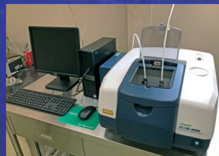
フーリエ変換赤外分光光度計

燃焼除害装置、バグフィルター、アルカリス クラブ、吸着除害装置の組み合わせで 最適な除害処理を実施いたします。