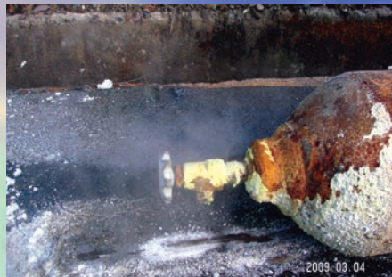
腐食性ガスの漏洩