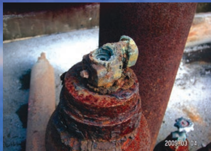
ガスによる容器、バルブの腐食