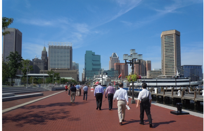
ボルチモアのウォーターフロント

ボルチモアはメリーランド州、東海岸にある中規模都市で人口は約65万人、大リーグのボルチモア・オリオールズの本拠地です。港湾都市でもあり、ウォーターフロントは非常に快適に開発されており、市民の憩いの場にもなっており、米国としては美味しい海鮮料理を頂くことができます。