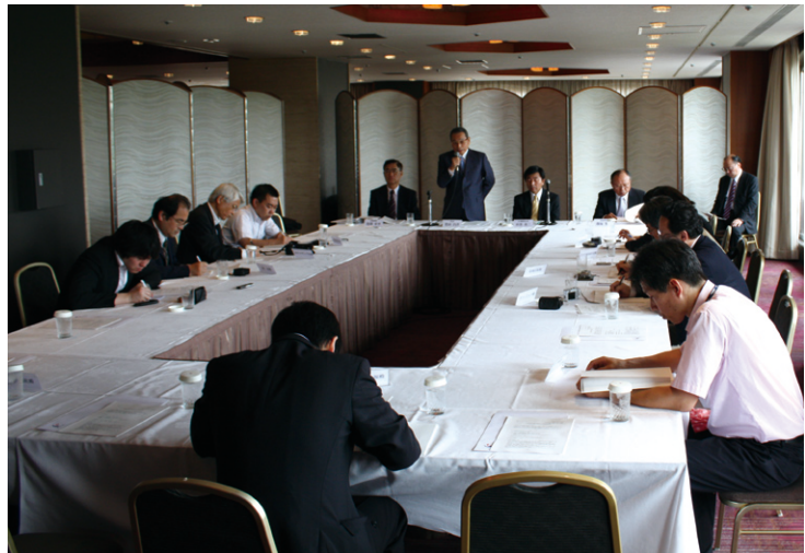
(H23年6月15日 会長記者会見)

四つ目が積極的な広報活動による当協会活動の迅速な情報の開示、PR です。昨年度、広報組織を総務部会のワーキンググループから委員会への格上げを行いました。また、本 JIMGAnews の隔月の発行による、本部や地域本部の活動の発信、会長の定期的な記者会見を実施することで、協会活動の認知度の向上、透明性の高い組織運営を目指します。