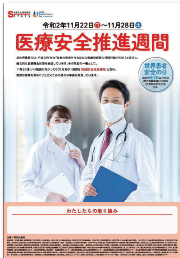
ポスター (自由記載欄あり)