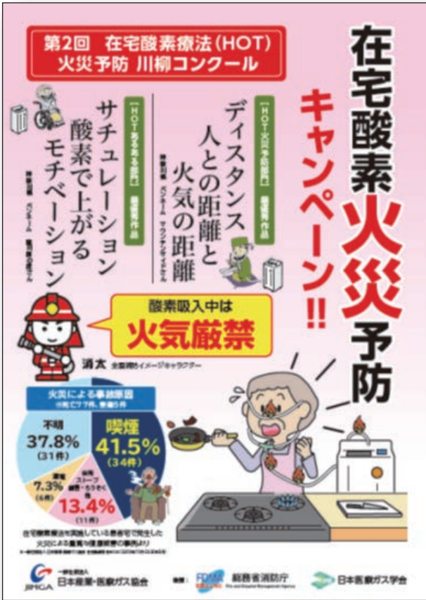
キャンペーンポスター