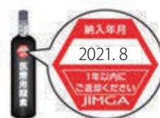
納入月ラベル (イメージ)

「医療ガス容器保安対策指針(PDF版)」、「各都道府県の容器管理指針の発行状況」はJIMGAウェブサイトに掲載しています。（閲覧には会員ログインが必要です）